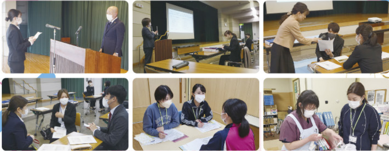
入団式・就業前職員研修の様子

4月から事業団で働く新採用職員の入団式・就業前職員研修を3月4日～6日の3日間行いました。1・2日目は入団式と座学による研修を行いました。入団式では理事長から一人ひとりに内示が渡されました。研修では、法人の理念・基本方針、就業規則等や人権、社会人としてのマナーなど法人内外の講師を交えながら行いました。3日目は4月から勤務予定の所属に赴き、現場の雰囲気などを感じていただきました。皆さんどうぞよろしくお願いいたします！！