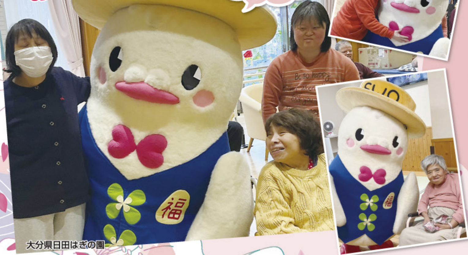
大分県日田はぎの園