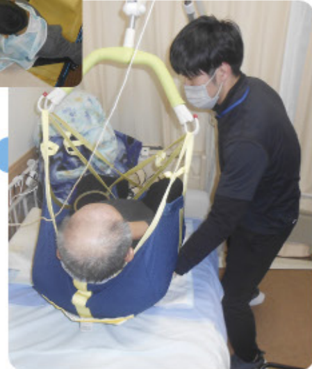
リフトを使用したベッド移乗