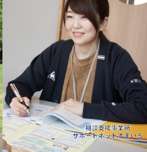
相談支援事業所 サポートネットすまいる