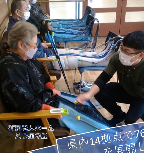
有料老人ホーム 八つ星の丘