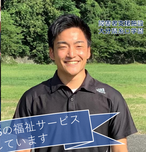
障害者支援施設 大分県糸ロ学園