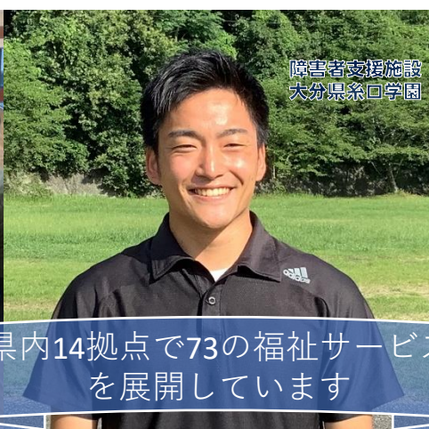
障害者支援施設 大分県糸口学園