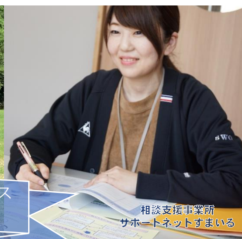
相談支援事業所 サポートネットすまいる