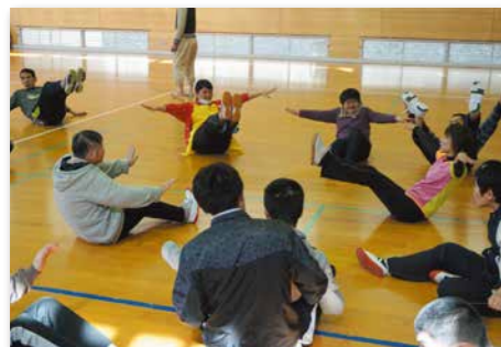
生き生き健康体操