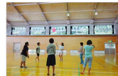
レクリエーション 風船バレー