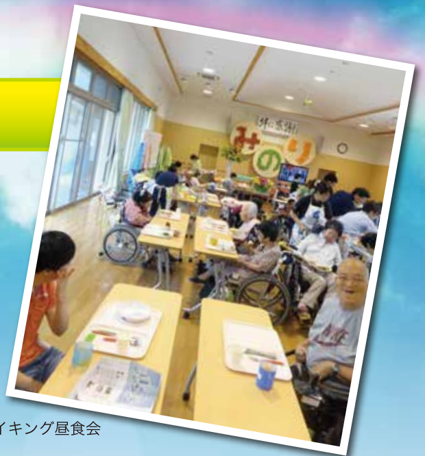
バイキング昼食会

排泄、食事、就寝、起床の介助を行います。 また、生活に関する相談への助言、その他 日常生活上の支援を提供します。